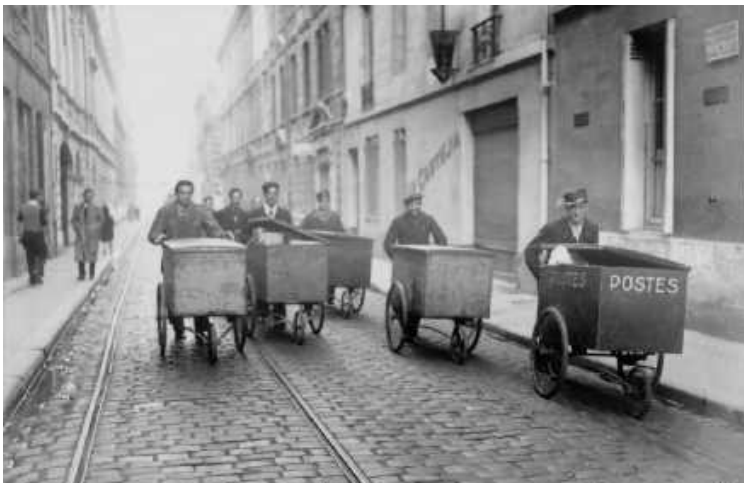
Tournée des postiers poussant des triporteurs, rue Castéja à Bordeaux en 1946